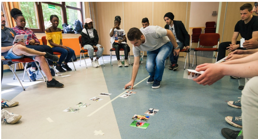
Aus dem Seminar „In welcher Gesellschaft wollen wir leben?“

Für Fragen stehe ich Dir gerne zur Verfügung: