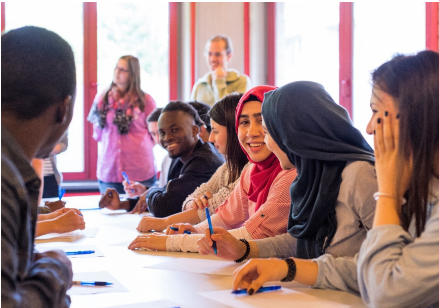
Teilnehmer*innen des Seminars „Neu in Deutschland“, umgesetzt vom Nell-Breuning-Haus in Herzogenrath.